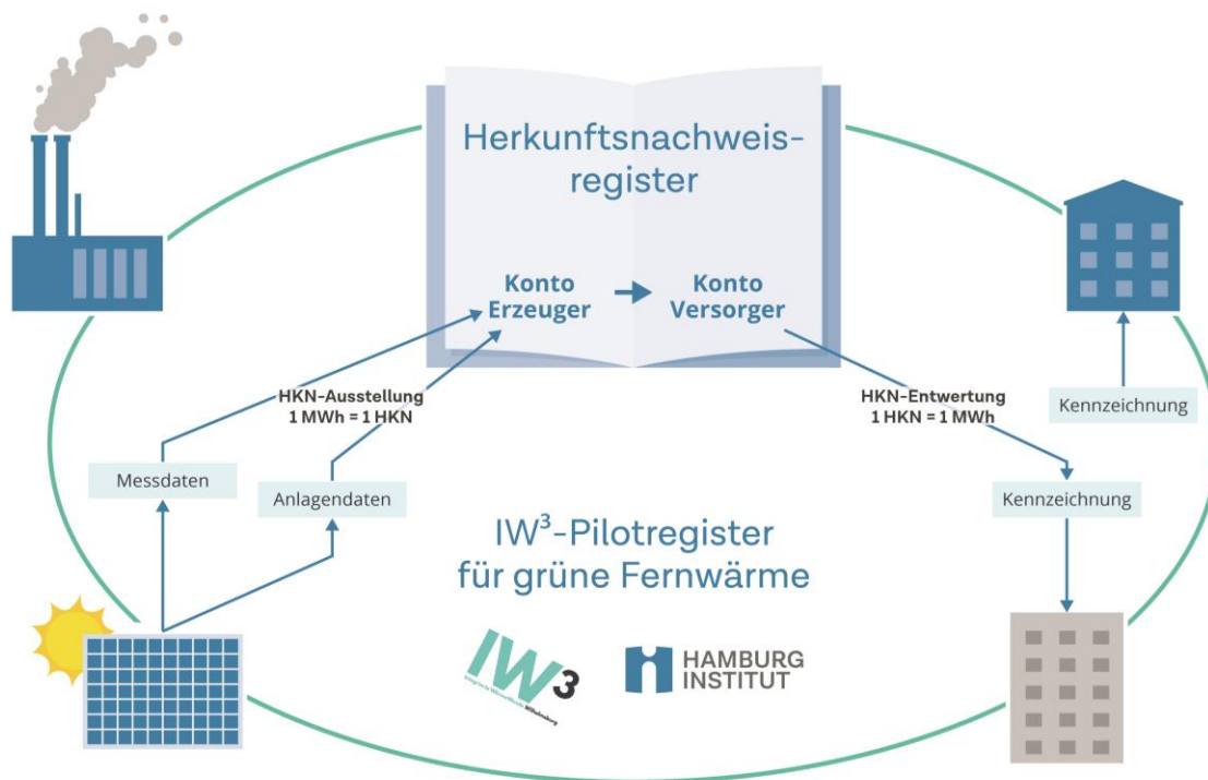
Abbildung 3: Grundprinzip eines HKN-Registers für Fernwärme und Fernkälte

Erfahrungen und Empfehlungen für eine nationale Umsetzung von Wärme- und Kälte-HKN zu generieren. Weitere Informationen sind auf Projekt- und Registerwebseiten verfügbar. 30